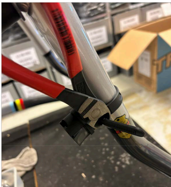
⑦ Tagliare la lunghezza eccessiva della cinghia con un tronchese o un coltello.