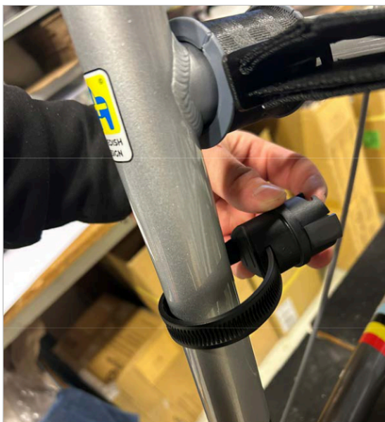
⑤ Inserire l'estremità della cinghia nella staffa.