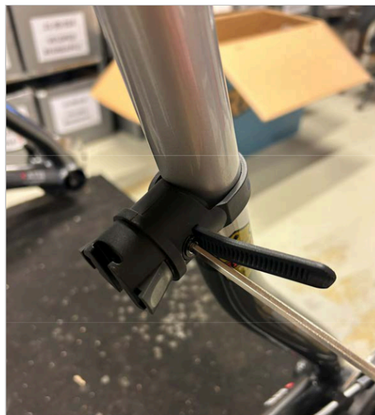
⑥ Stringere la vite/cinghia con la chiave a brugola da 4 mm fino a quando la cinghia non è stretta.